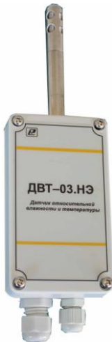
Рисунок 1 – Датчик относительной влажности и температуры ДВТ-03.НЭ1