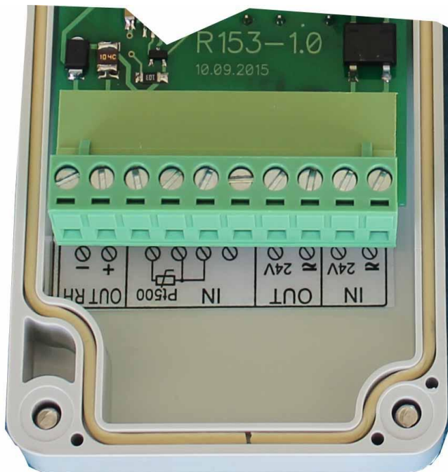
Схема подключения датчика относительной влажности и температуры ДВТ-03.НЭ1 на месте эксплуатации